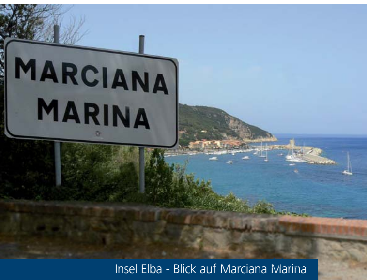
Insel Elba - Blick auf Marciana Marina