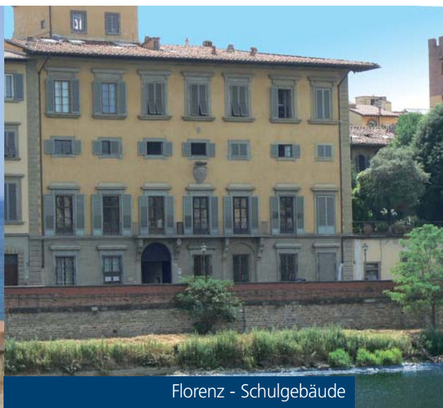
Florenz - Schulgebäude