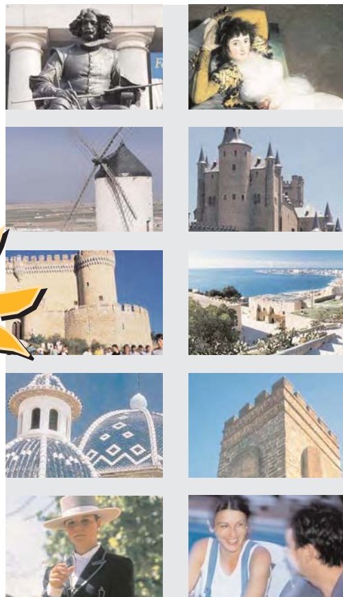
Actividades y excursiones