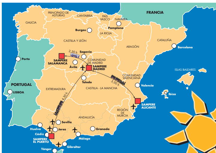
Situación de las cuatro Escuelas Sampere en España

Tausende von Kursteilnehmern zieht es nicht nur einmal, sondern immer wieder in die mediterrane Wärme Spaniens. Spanien bietet eine perfekte Kombination von Kultur und Klima: historische Städte, großartige Museen, lange Strände und prächtige Landschaften. Hinzu kommen die entspannte mediterrane Lebensart und die abwechslungsreiche Gastronomie. Die Spanier sind ein gastfreundliches, warmherziges Volk, dessen Lebensfreude sich in Musik und Tanz widerspiegelt. Das heutige Spanien ist Mitglied der EU und genießt weltweites Ansehen für seine Mode, seine Kunst und seine Filmproduktionen. Spanien erwartet Sie!