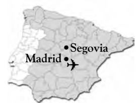
OISE in Spanien