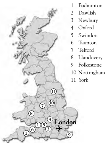
OISE in Großbritannien