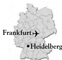
OISE in Deutschland

OISE bietet sowohl die Unterbringung in Gastfamilien als auch in Colleges in verschiedenen Orten an.