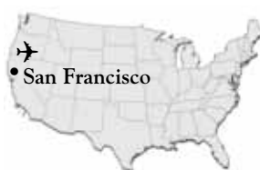
OISE in USA

OISE bietet sowohl die Unterbringung in Gastfamilien als auch in Colleges in verschiedenen Orten an.